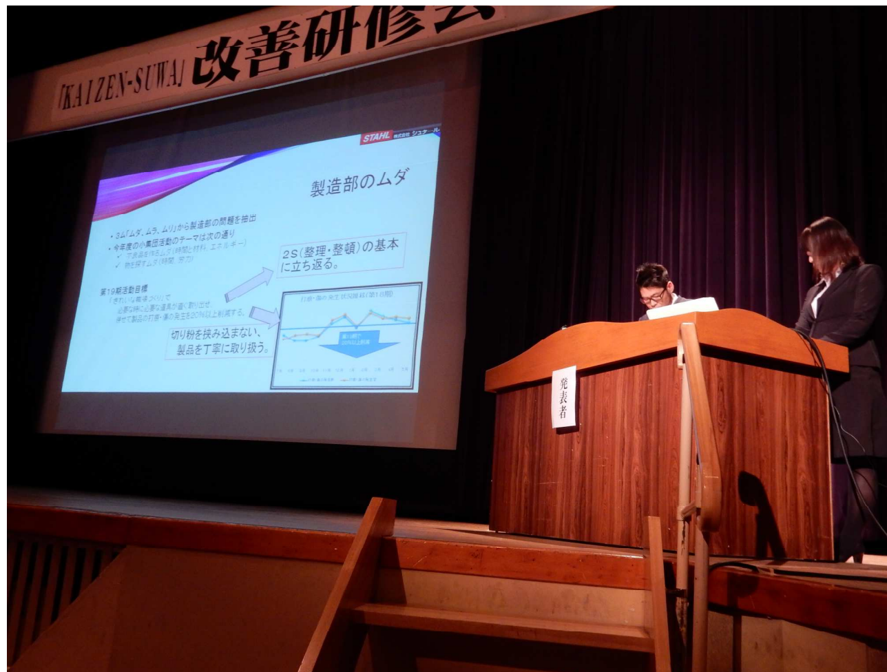
▲ 発表者2名が分担し合って発表（製造部の発表）