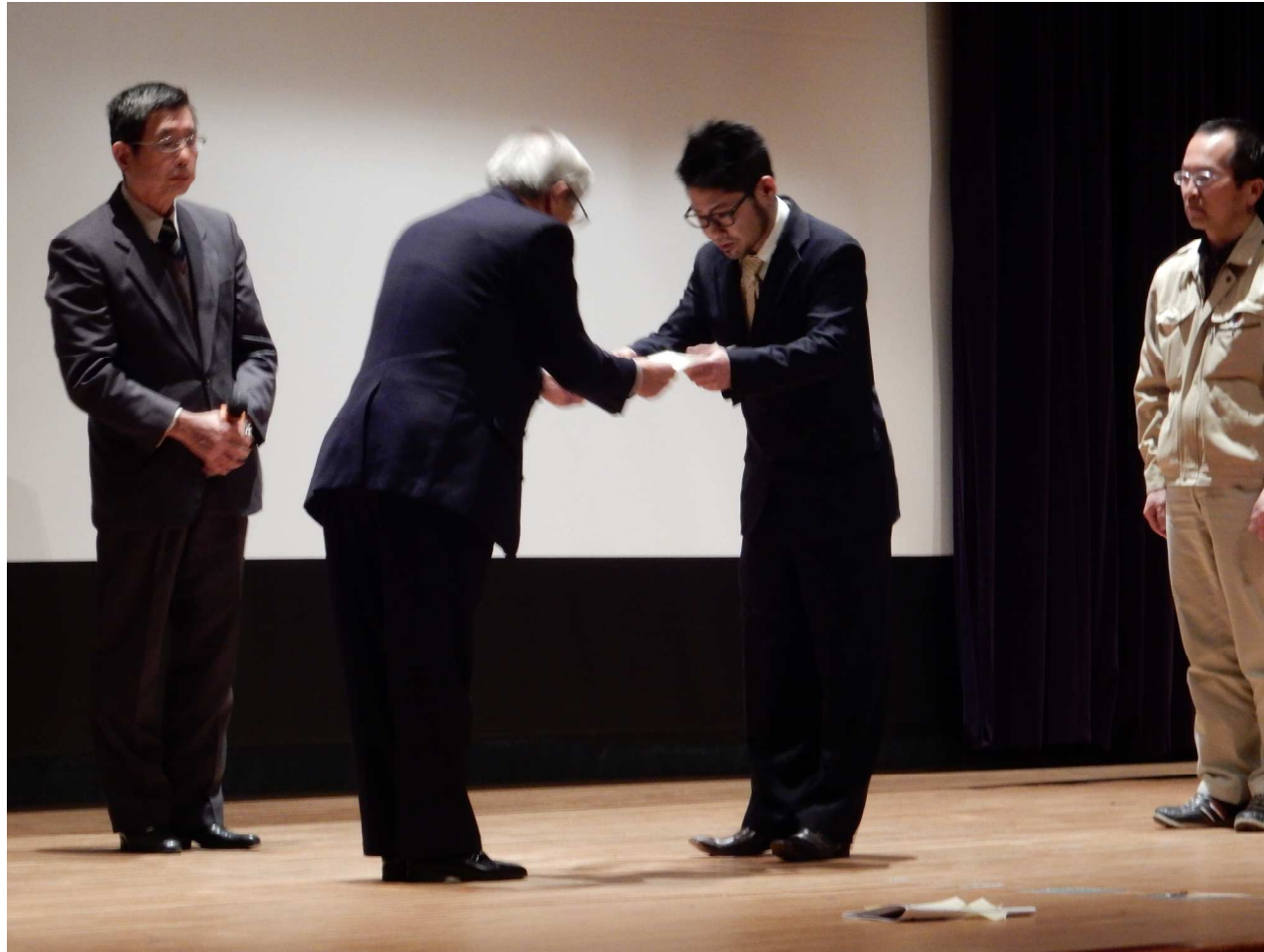
▲ 発表に対して表彰状授与