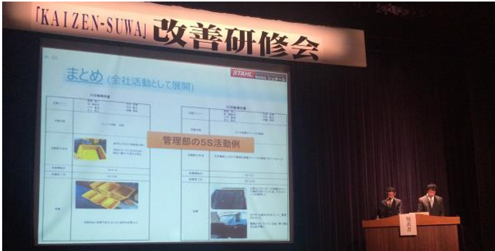
▲ 発表者が2名登壇し、発表 (3/3)