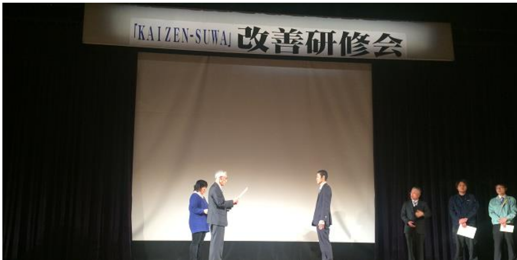
▲ 発表に対して表彰状授与